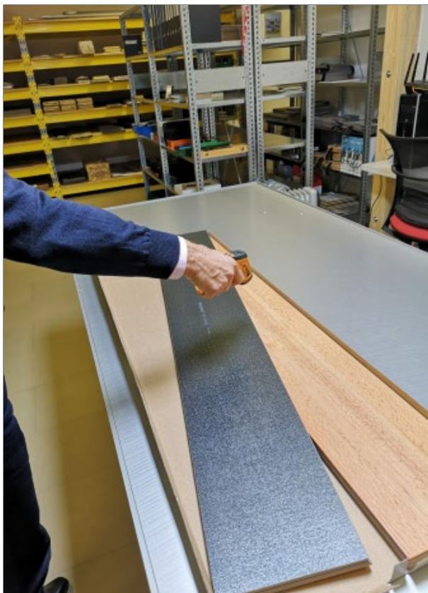
Abbildung 6: Messung an der mittleren Diele im Paket