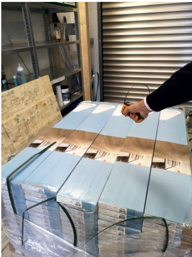
Abbildung 4: Messung an den Paketen oben der Palette