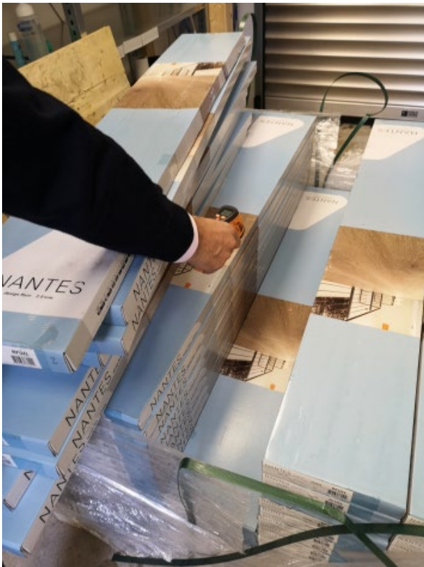
Abbildung 5: Messung an den Paketen in der Mitte der Palette