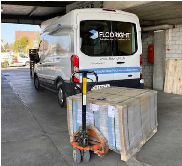
Abbildung 3: Palette und Transporter